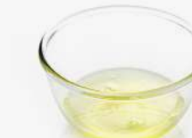
Clara de huevo