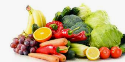
Frutas y vegetales