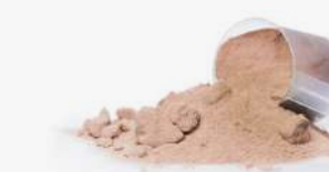
Proteína en polvo